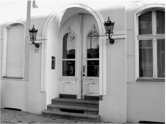
Von diesem Haus Mannheimer Straße 27 (damals 43) wurde Rosa Luxemburg ins Hotel Eden am heutigen Olof-Palme-Platz verschleppt.